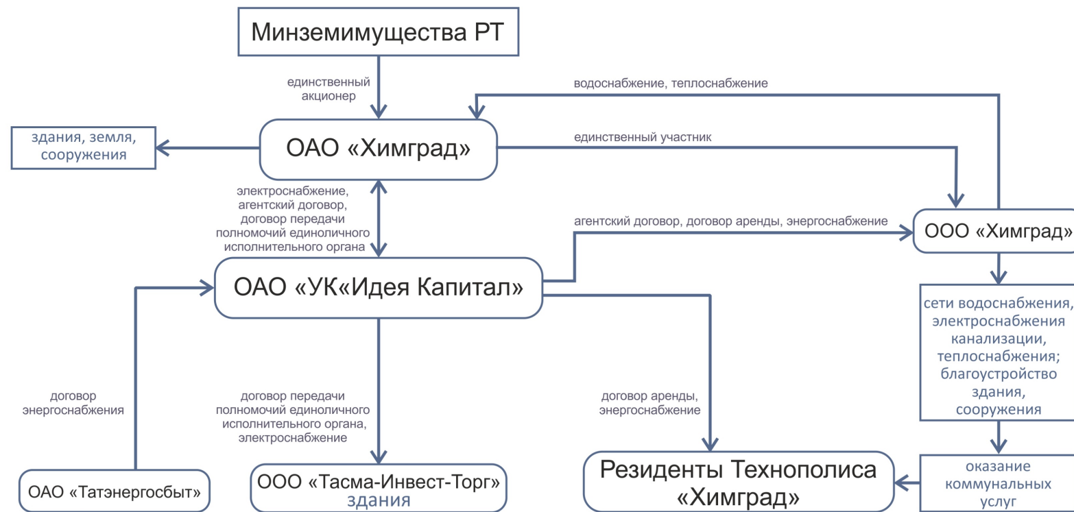
Схема органов управления Технополиса «Химград»