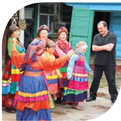
Три села Бурятии (Большой Куналей, Десятниково, Ярикто) входят в список самых красивых деревень России.