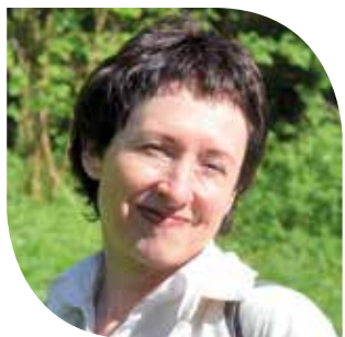
ИВА ЛЕБЕДЕВА, президент Национальной ассоциации сельского и экотуризма (Москва)